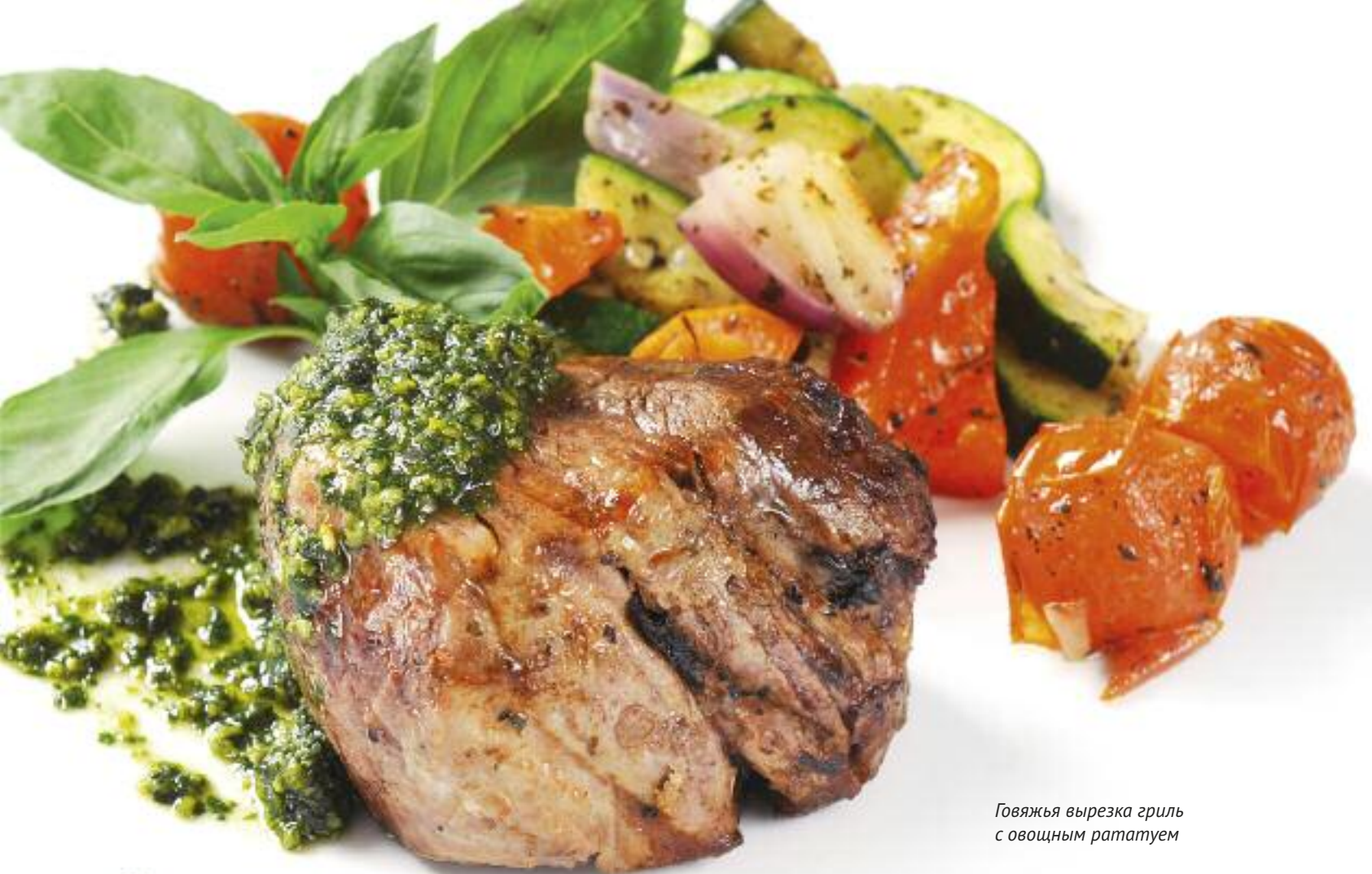
Говяжья вырезка гриль с овощным рататуем