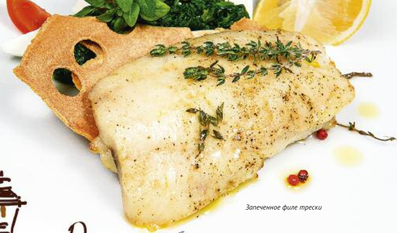
Запеченное филе трески