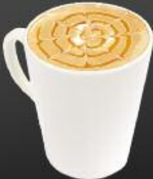
Капучино ванильный с карамелью