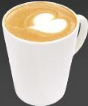
Капучино 320 мл