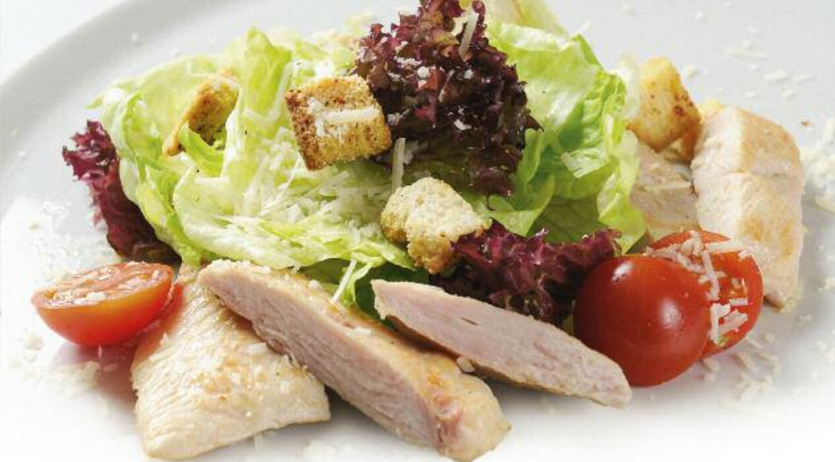
Цезарь с курицей