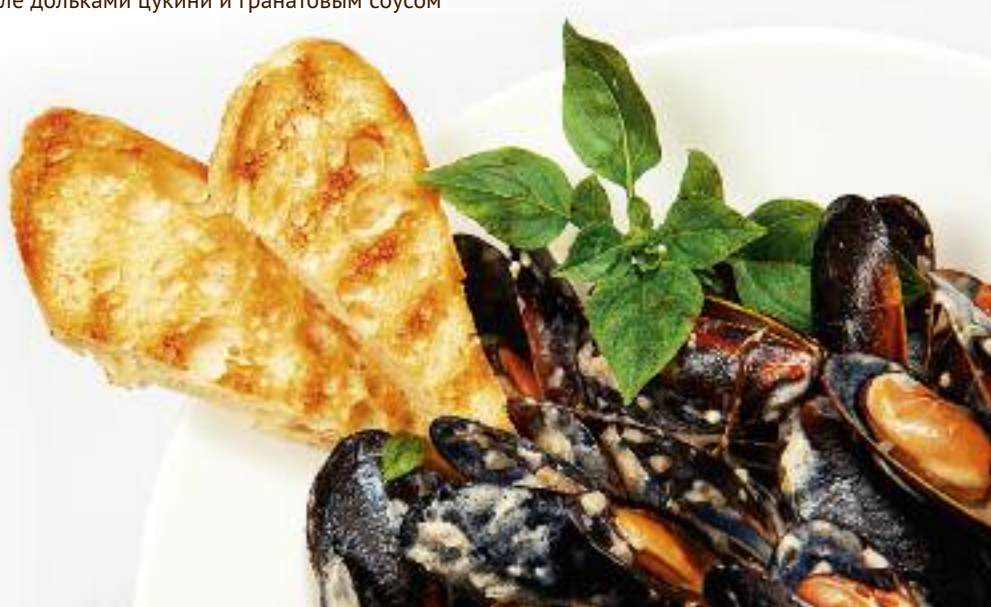
Большая тарелка мидий в сливочно-сырном соусе

Запеченная дорада с обжаренными на гриле дольками цукини и гранатовым соусом