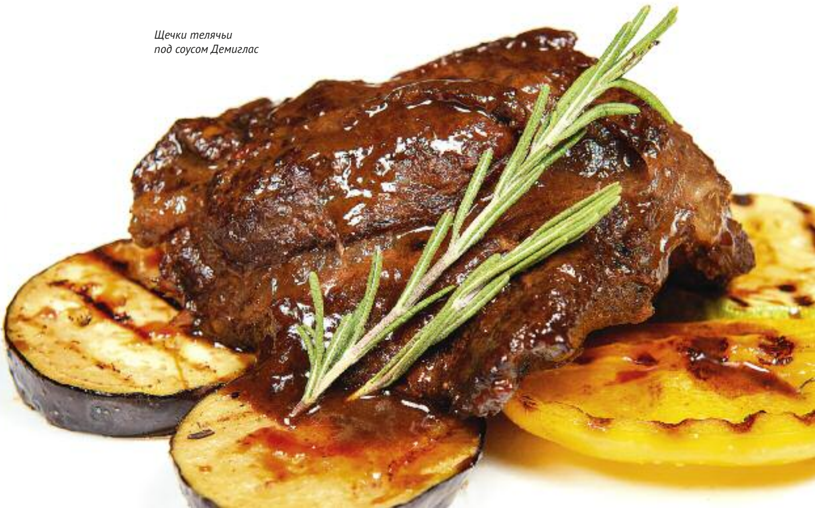
Щечки телячьи под соусом Демиглас

Свиные миньоны с белыми грибами и картофельными крокетами _____ 1/320 _____ 740