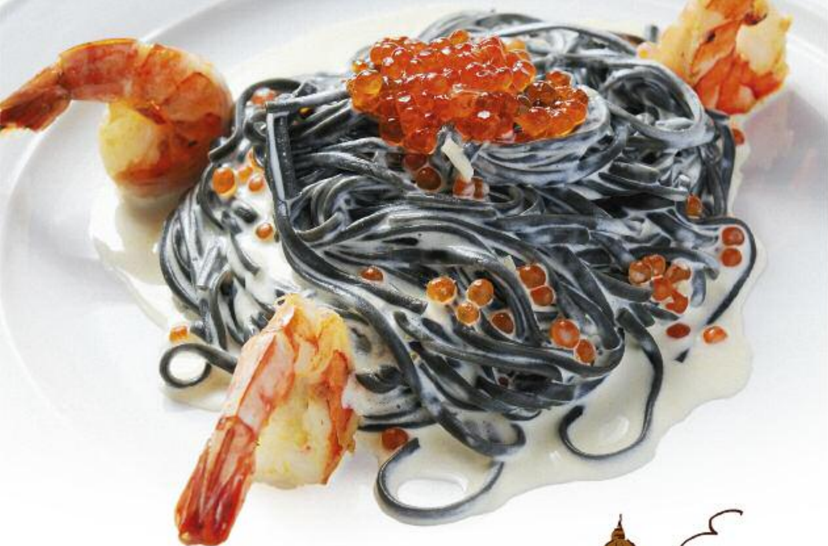
Черные тальолини с икрой и креветками