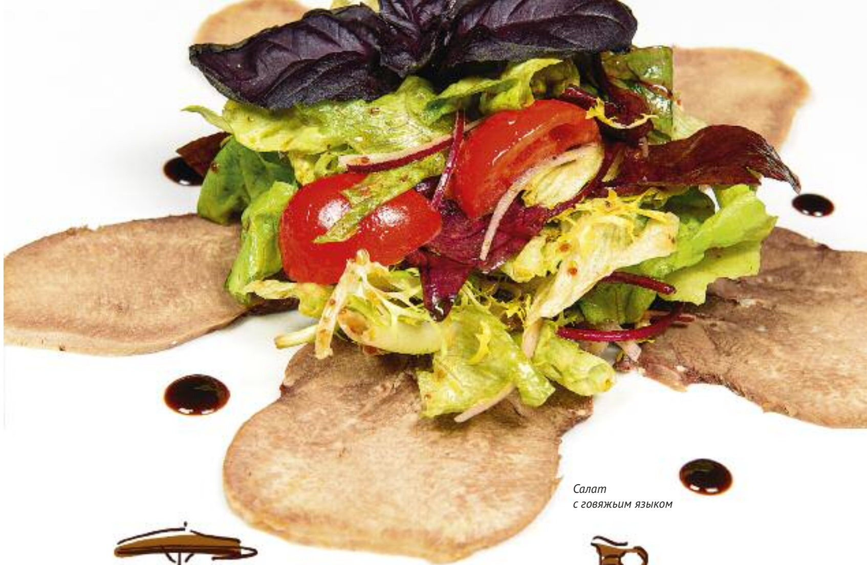
Салат с говяжьим языком