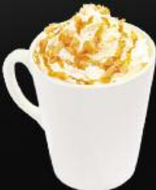
Капучино ореховый со взбитыми сливками и орешками