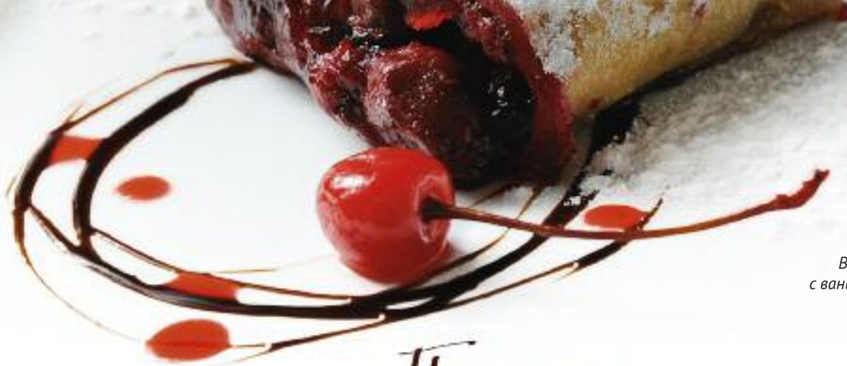
Вишневый штрудель с ванильным мороженым