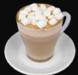
Какао с маршмеллоу