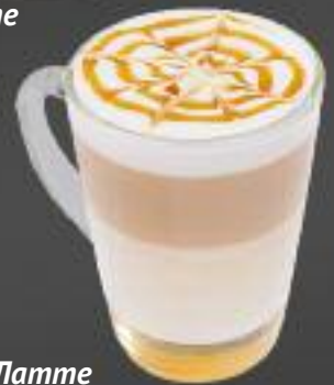
Латте банановая карамель