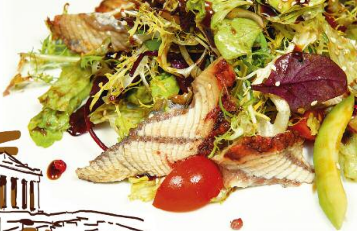
Салат с угрем